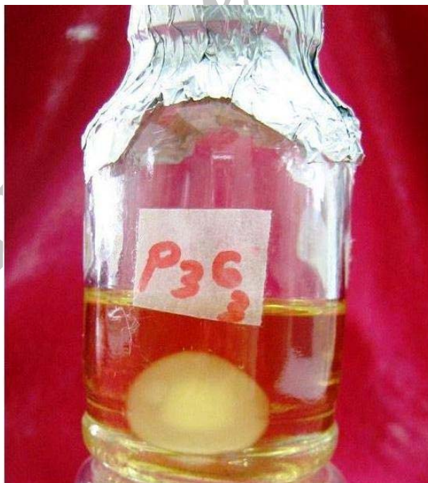
شکل ۱- رشد توده میسلیومی در کشت غوطه‌ور قارچ گانودرما